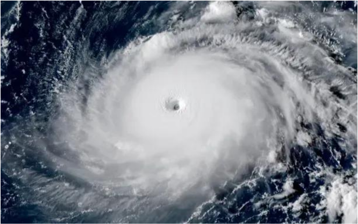
Bão số 3 Ảnh tự vệ tinh.

Theo Trung tâm Dự báo khí tượng thủy văn quốc gia, sáng ngày 4/9, vị trí tâm bão số 3 ở vào khoảng 19,0 độ vĩ bắc; 117,5 độ kinh đông, trên vùng biển phía đông khu vực bắc Biển Đông, cách đảo Hải Nam (Trung Quốc) khoảng 730km về phía đông. Sức gió mạnh nhất vùng gần tâm bão mạnh cấp 12 (118-133km/giờ), giật cấp 15. Bão di chuyển theo hướng Tây Tây Bắc, với tốc độ khoảng 10km/giờ.